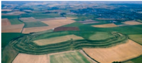
Environ deux cents familles vivaient sur le site de Maiden près de Dorchester à l'âge du fer. Maiden provient des mots celtes Mai Dun , signifiant « grande colline ».

C'est au cœur des dunes du Wiltshire que les traces les plus remarquables d'une civilisation née il y a environ cinq mille ans sont encore visibles. À proximité du village d'Avebury, à Stonehenge, ou encore sur la colline des Géants – une suite de tertres –, d'incroyables vestiges dressent leurs mystérieux signaux de pierre.