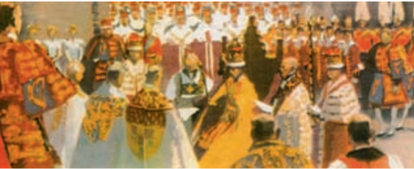
Couronnement de la reine Elizabeth II, le 2 juin 1953.