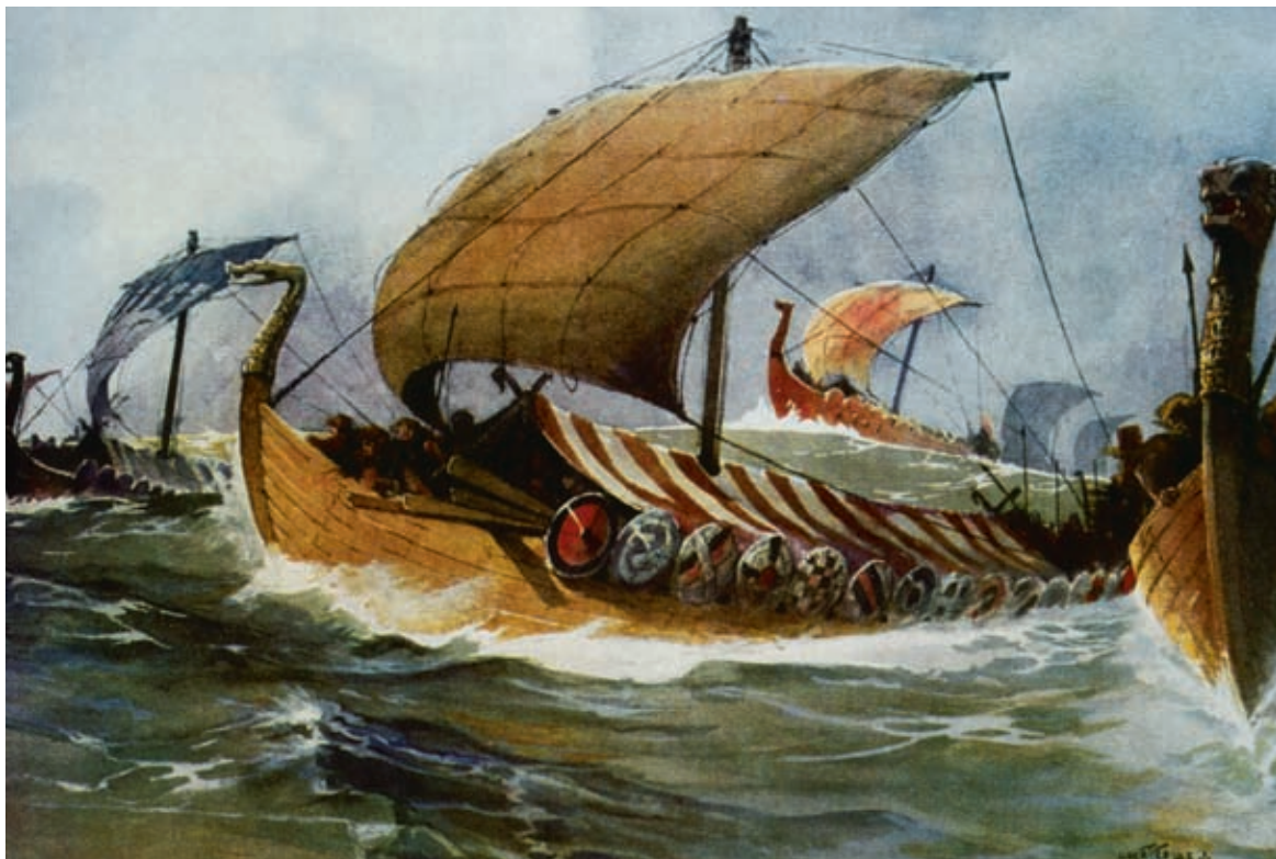
Navires vikings cinglant vers l'Angleterre.

Devant l'audace croissante des Pictes et des Scots, un chef breton, Vortigern, recherche le soutien de troupes saxonnes, celles de Hengest et Horsa, qui franchissent la mer. Il leur offre des terres en échange de leur soutien militaire. Une fois dans la place, les Saxons se retournent contre les Celtes. Les Romains commencent à évacuer la Bretagne dès 410. En 418, selon une chronique tardive, ils quittent définitivement la Bretagne, cachant ou emportant leurs trésors.