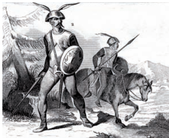
Guerriers anglo-saxons (vers 500).