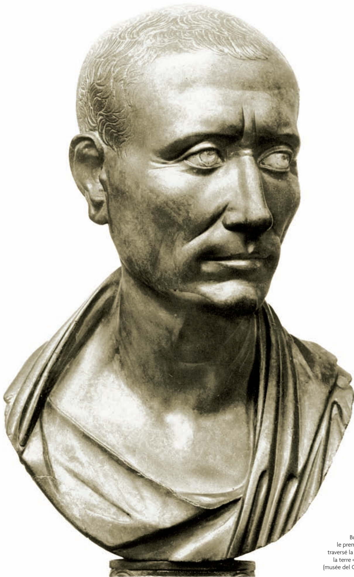
Buste de Jules César, le premier Romain à avoir traversé la Manche et touché la terre « grande bretonne » (musée del Campo Santo, Pise).