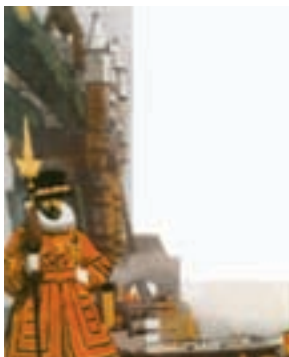
Un yeoman à la Tour de Londres..