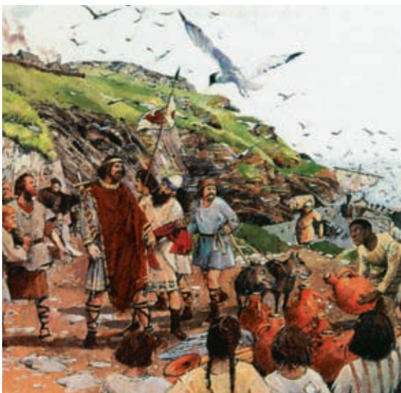
Le roi Arthur devant Tintagel en Cornouailles, son lieu de naissance.

Les Celtes semblent avoir atteint les îles Britanniques avant le fameux voyageur grec