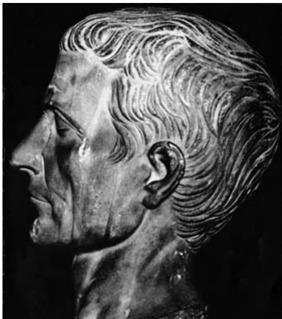
Cette tête de Jules César montre bien le caractère volontaire du conquérant.