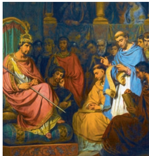
Le moine anglais Alcuin, conseiller le plus proche de l'empereur Charlemagne.

Mais le grand conquérant n'aime guère les revers. Dès -54, il est de retour. Les Bretons, avertis par sa première tentative, sont parvenus à s'unir autour d'un chef vaillant, Cassivellaunus. Les Romains, parvenus à la Tamise, décident de négocier. Réussissant à diviser les Celtes, ne combattant que certaines tribus, César finit par traiter avec Cassivellaunus. La Bretagne, du