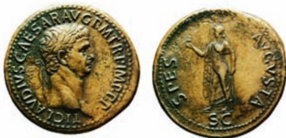
Monnaie représentant l'empereur Claude, le véritable conquérant de la « Grande Bretagne » en 43, au point de nommer son seul fils Britannicus !

circulaire, probablement dans l'axe du lever du soleil au solstice d'été. Une seconde étape aurait consisté à creuser cinquante-six grandes excavations (des tombes ?), dits « trous d'Aubrey » (du nom de l'archéologue qui les a découvertes). Une troisième phase, amorcée sans doute au xxii siècle av. J.-C., voit l'érection des quatre-vingts pierres bleues de quatre tonnes chacune, disposées en fer à cheval, formant le cromlech. Or ces pierres proviennent du pays de Galles, à plus de 200 kilomètres : elles ont sans doute été tractées sur des radeaux. Six siècles plus tard, ces monolithes sont abattus et une trentaine d'énormes blocs de grès, extraits de la carrière plus proche des Marlborough Downs, se voient disposés en cercle concentrique. Cinq trilithes forment un centre, ouvrant des portes de sept