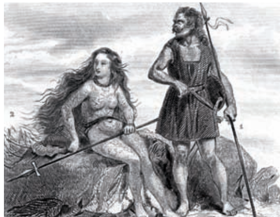
Guerrier et guerrière scots.

nent de défier la sagacité des archéologues. Comment, par exemple, a-t-on pu édifier le cirque de Stonehenge dont les trilithes (deux pierres levées supportant une pierre horizontale) dépassent cinquante tonnes ? D'autant que c'est à l'orée de l'an 3000 av. J.-C. que les pierres bleues de Stonehenge (dont le nom signifie « pierre suspendue ») ont commencé d'être disposées en arc de cercle autour d'un centre où repose ce qui ressemble à une pierre d'autel. L'ensemble des constructions constituant le Temple se serait étalé sur mille cinq cents ans ! La première pierre aurait été la fameuse Heel Stone (« pierre talon »), dressée dans un vaste fossé