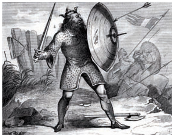
Guerrier anglo-saxon (vers 750).

légions largement composées de soldats celtes qui défendent les murs d'Hadrien et d'Antonin face aux Pictes et aux Scots. Mais il faut, dès la fin du III e siècle, renforcer la flotte qui garde la mer du Nord et la Manche, la Classis britannica , pour