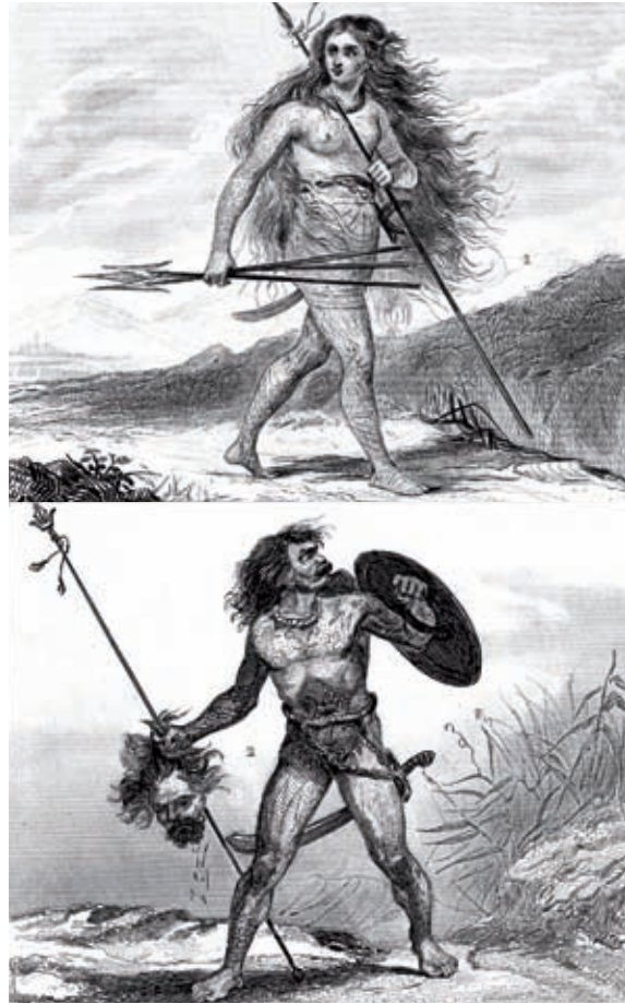
Guerrier et guerrière pictes.

Pythéas qui leur donna, vers 325 av. J.-C., le nom de Prétanniques. Deux siècles plus tard, Poseidonius confirme les observations du Grec quant au commerce de l'étain avec les Gaulois. Les Celtes utilisent la monnaie, cultivent du blé, pratiquent l'élevage, la chasse, la pêche.