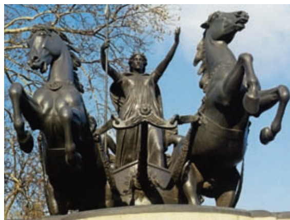
Statue de Boudicca (devant le Parlement de Londres) qui conduisit une vaste révolte contre les Romains en 61, sous le règne de Néron.

De notre point de vue, la multiplicité des dates de construction et les modifications successives du site plaident pour l'hypothèse d'un espace multifonctionnel. Ainsi, la fonction du site de Stonehenge aurait-elle évolué au fil des siècles. Une chose est sûre cependant : Stonehenge a servi de carrière de pierres au Moyen Âge pour édifier la cathédrale de Salisbury, toute proche... Quant aux populations qui ont édifié ces mégalithes, dont on suppose qu'elles auraient pu venir d'Espagne, elles ont développé des échanges