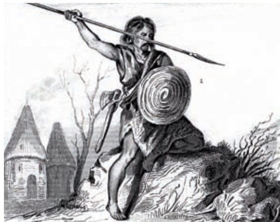
Guerrier (grand) breton.

À l'abri des invasions gothiques, la Bretagne connaît son apogée au IV e siècle. Ce sont des