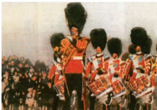
Musique des gardes royales.