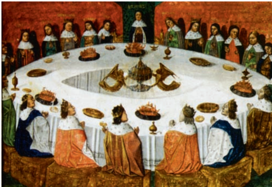
La Table ronde du roi Arthur.

la survie des âmes et sans doute croient en la métempsychose.